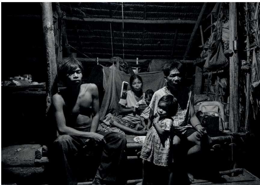
Peuple palawan, île de Palawan, Philippines. Pages précédentes : Des enfants jouent dans un potager de tubercules aux feuilles géantes. Ci-dessus, en haut : Adultes et jeunes jouent à se balancer au bout d'une liane sur une pente. Ci-dessus, en bas : Pendant les longues soirées, les cartes mémoires des téléphones portables déversent de la pop malaise ou philippine. Ci-contre : Un garçon aide ses deux petites sœurs à traverser le torrent en cru suite aux trombes d'eau de la mousson.