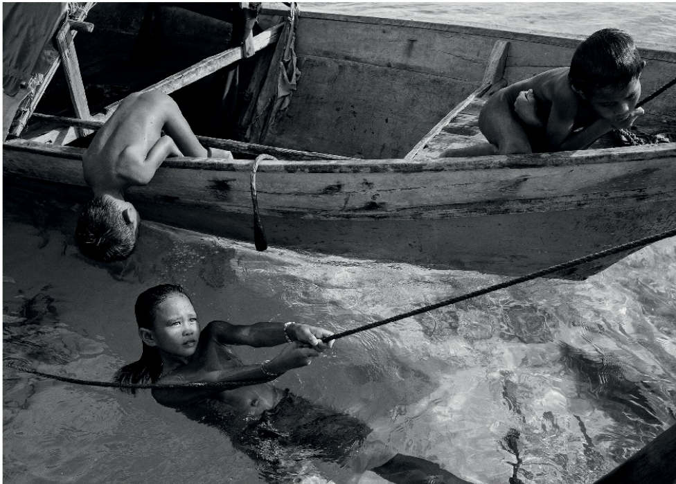
Peuple Badjao Bornéo. Page 150 – 151 : Demain ce bateau partira pour une partie de pêche en haute mer. Il a fait le plein de vivres et de carburant. Nul ne sait quand il reviendra. État de Sabah, Malaisie. Page 152 : Des enfants pêchent avec un filet de petits poissons et crevettes et jouent dans l'eau.