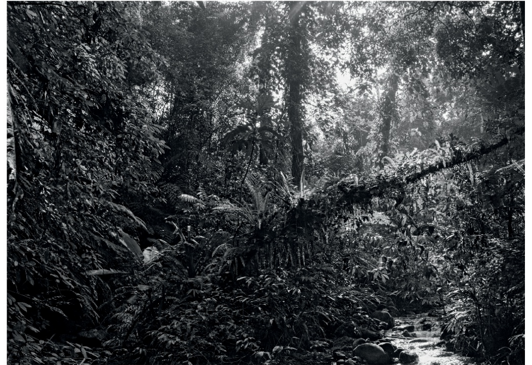
Peuple palawan, île de Palawan, Philippines. Ci-contre : Un jeune perché sur un tronc d'arbre coupé sur son nouveau champs, regarde le jour se lever sur la vallée. Ci-dessus : Au fond de la vallée courent des torrents où l'on pêche des petits poissons, des anguilles, des crabes et des crevettes en faisant attention à ne pas se faire mordre par les nombreux serpents qui s'y trouvent.